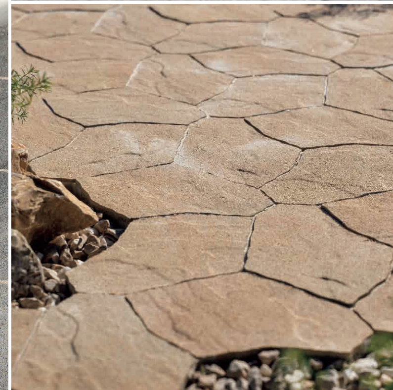
左:スモーキーグレー 上:スモーキーグレー 下:サンドオーカー