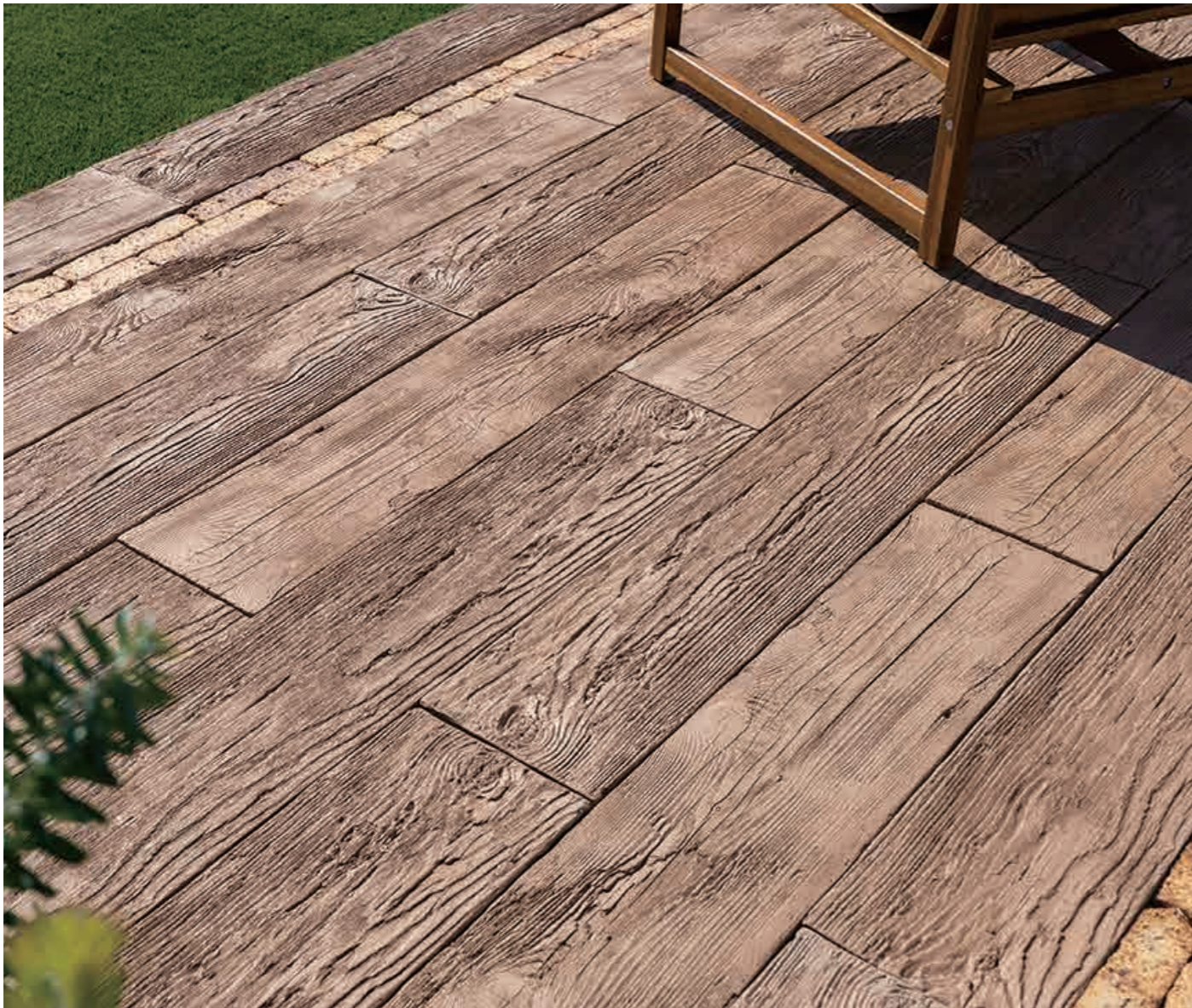
ナチュラルウッド