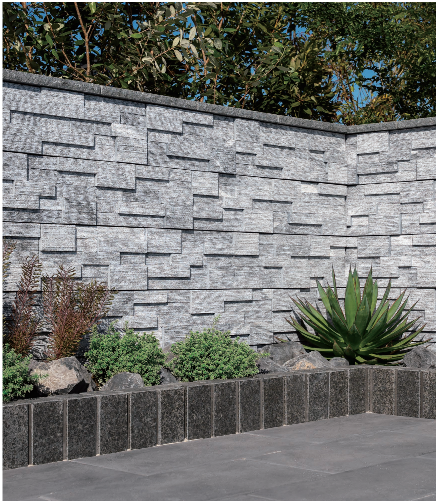
グレー(笠木:グレー)