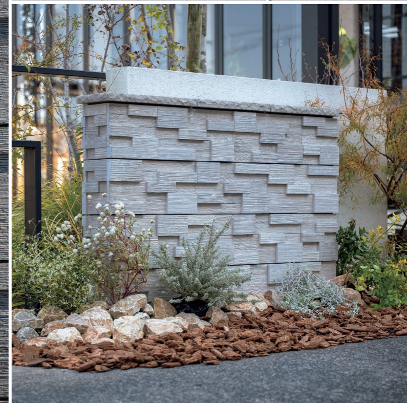
左:ブラック(笠木:ブラック) 上:ブラック(笠木:ブラック) 下:アイボリー(笠木:アイボリー)