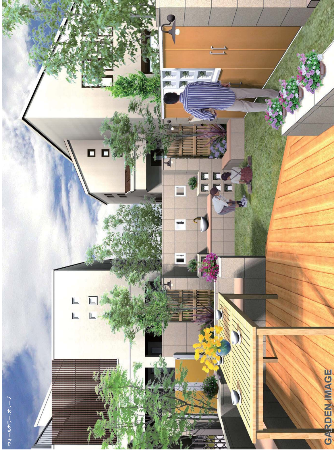
ウォールカラー・オリーブ