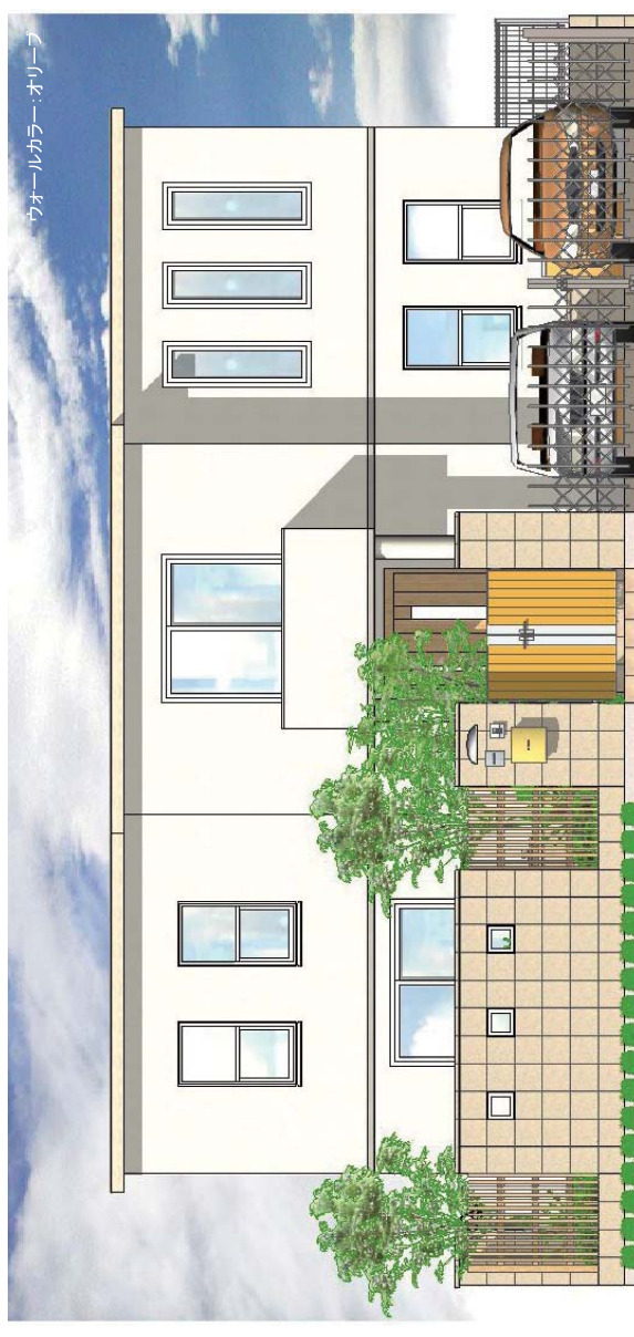
ウォールカラー・オリーブ